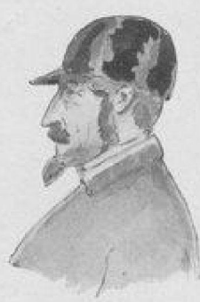
Baron de Cassin