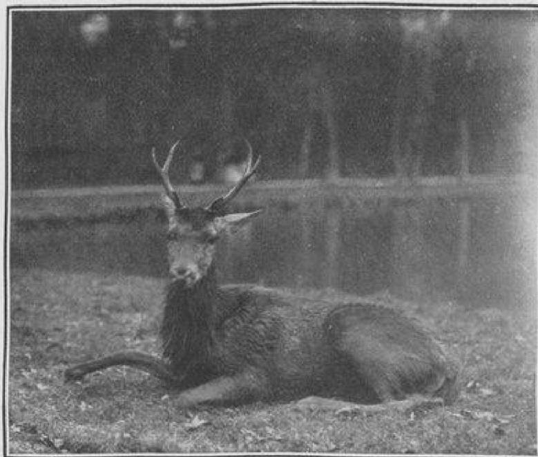
LES FUTAIES DU PARC NE RETENTISSENT PLUS DU SON JOYEUX DES CORS NI DE LA VOIX ENTRAÎNANTE DES CHIENS