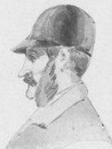
Comte A. d'Oyron